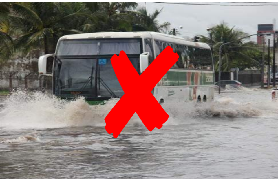
Vias sem drenagem subterrânea