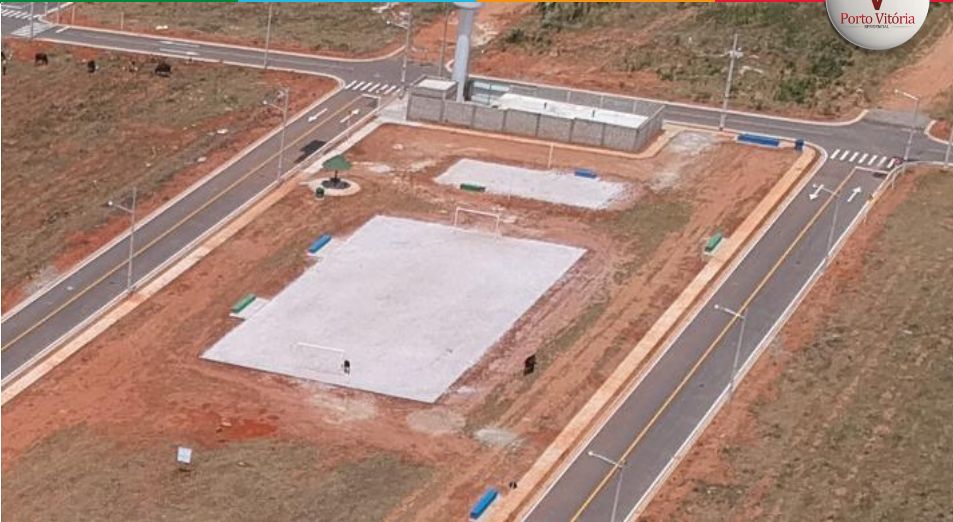
Campo de futebol de areia