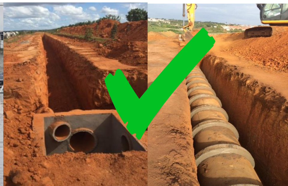
Vias com drenagem subterrânea